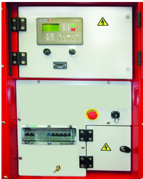
PANEL DE SALIDA ACP

Bornero para conexión desde ACP al cuadro LTS.